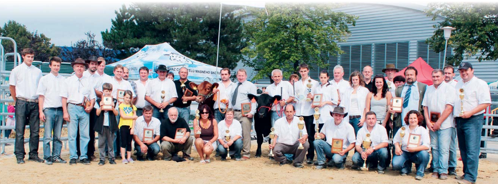
Šťastní chovatelé v závěru show