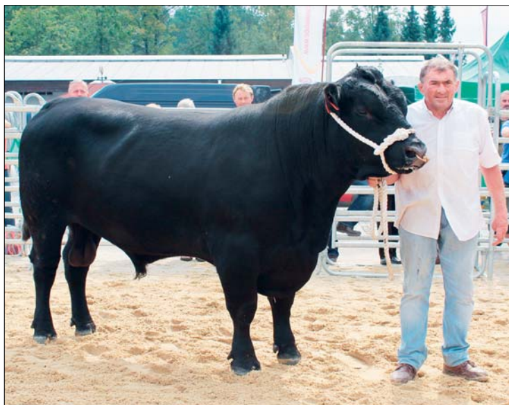
Vítězný mladší býk ZAA 808 Tuscon